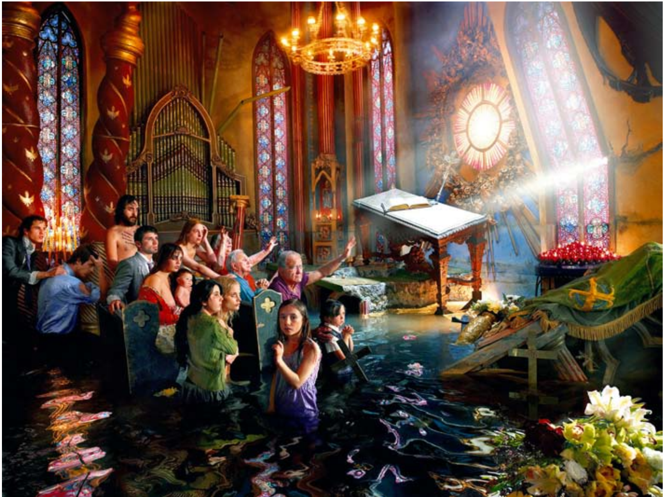
Cathedral, série Déluge, 2007 © David LaChapelle