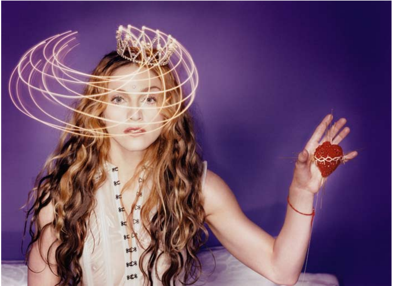
Madonna, Time Lapse Photograph Spiritual Value , série Star System , 1998 © David LaChapelle