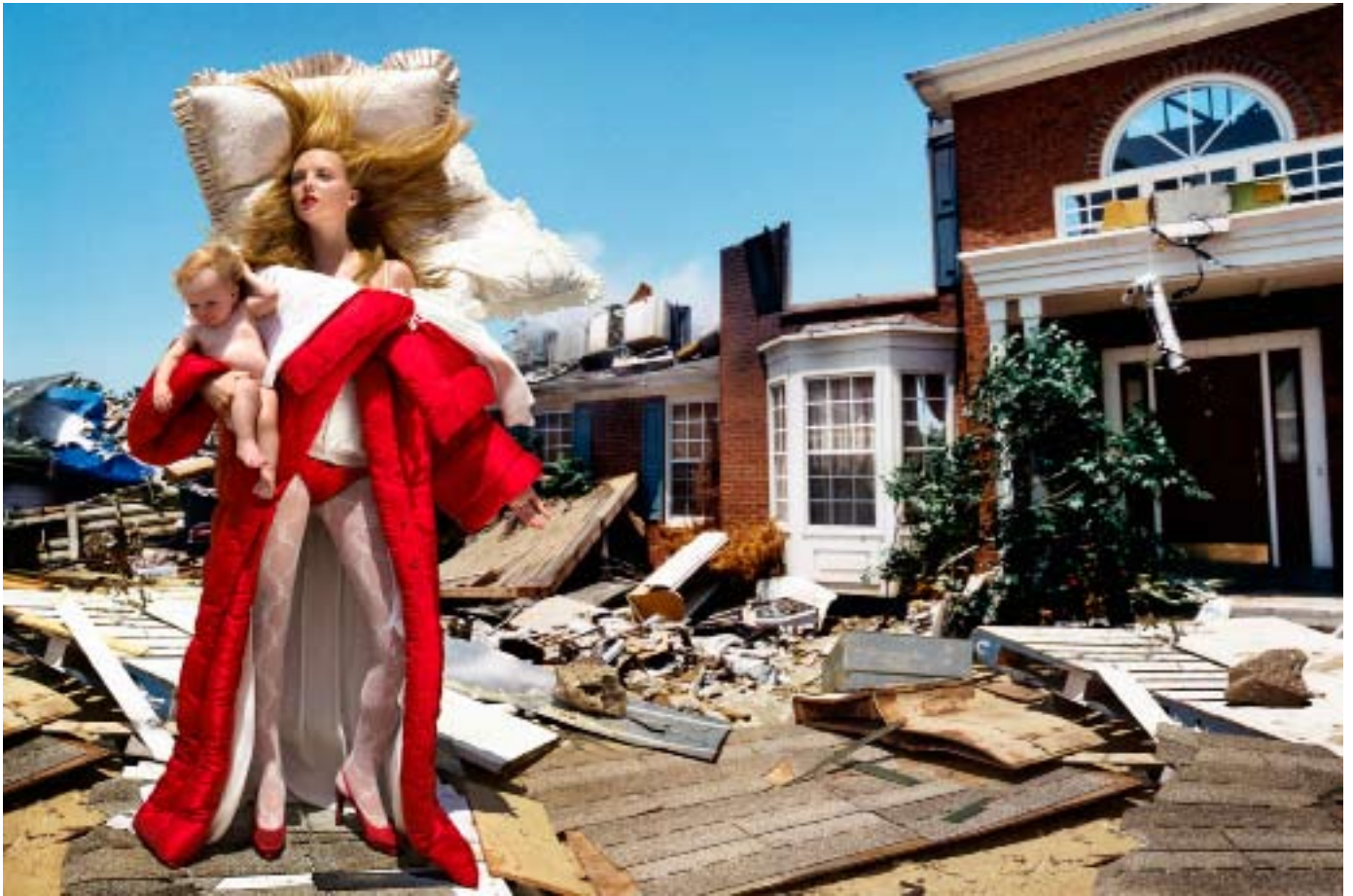
The House at the End of The World, série Destruction and Disaster, 2005 © David LaChapelle