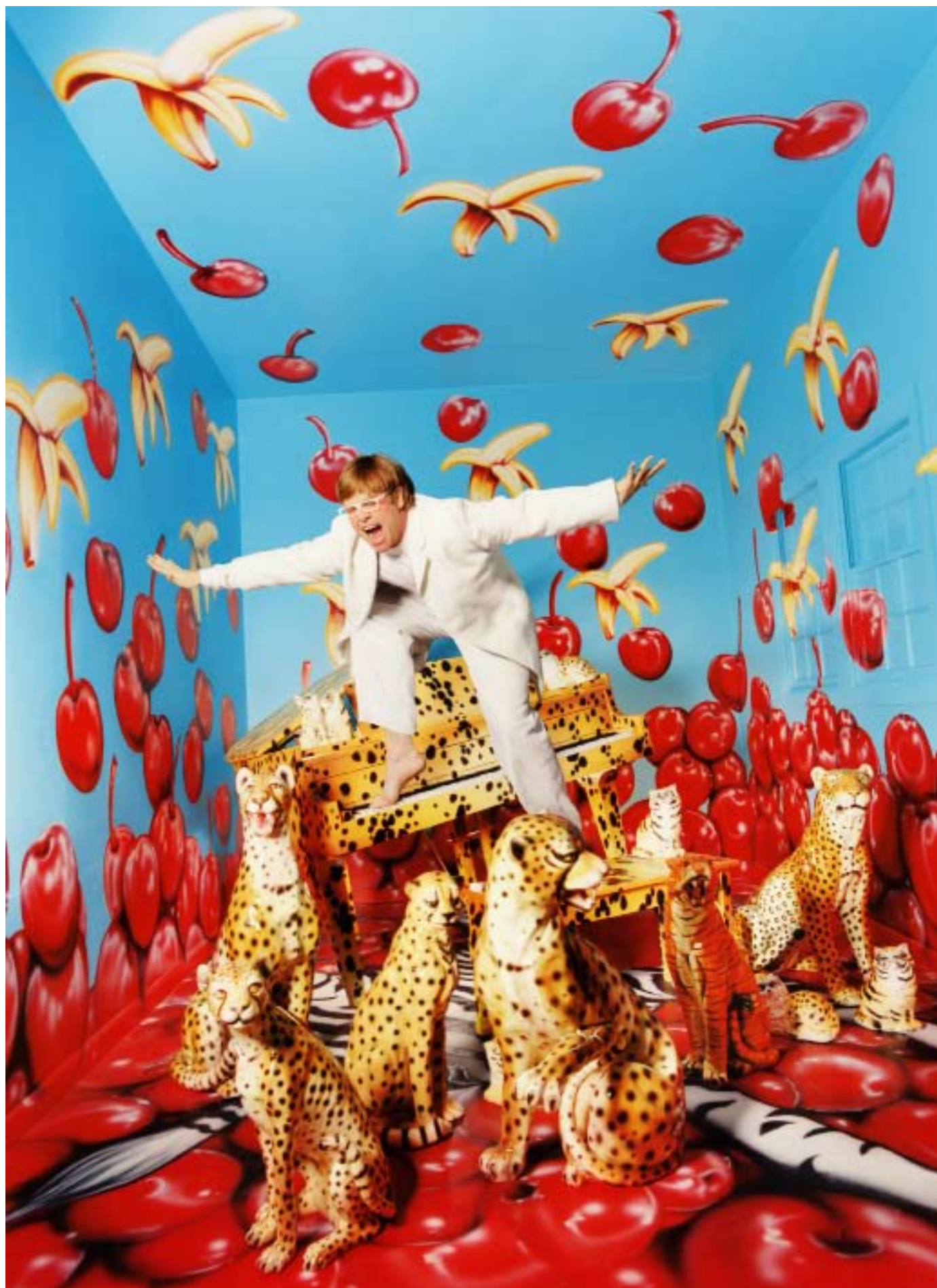
Elton John, Never Enough, Never Enough, série Star System, 1997