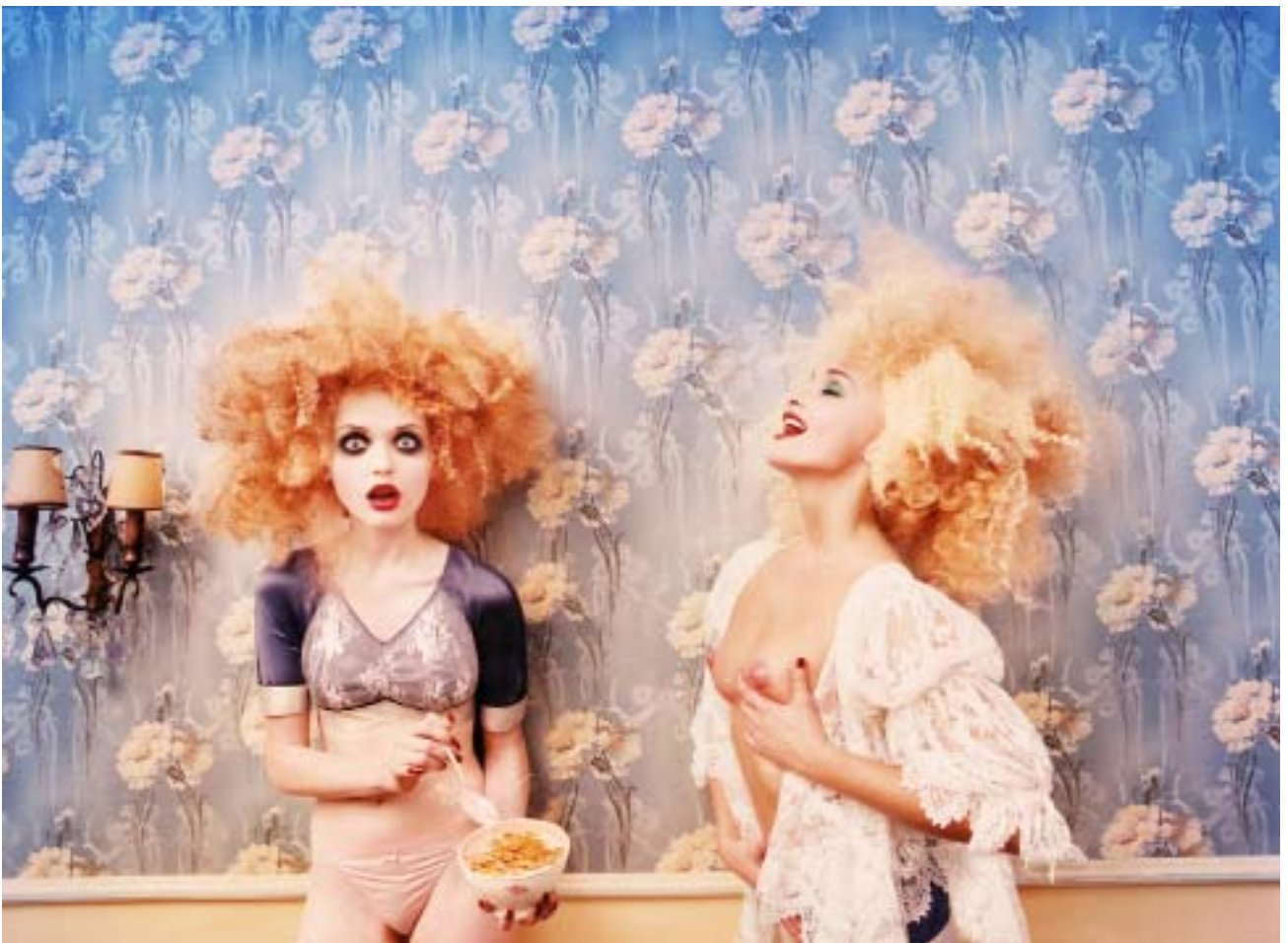
Milk Maidens, série Excess, 1996 © David LaChapelle